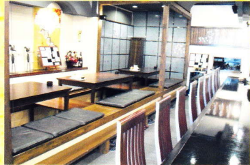
店舗座敷 (30名様まで収容可能)